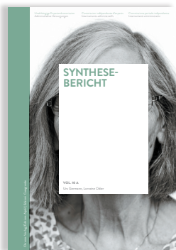
Volume 10 RAPPORTO DI SINTESI

Il volume che raccoglie le fonti d'archivio della CPI contiene una selezione di testi delle persone internate per via amministrativa e delle persone che hanno ordinato tale provvedimento.