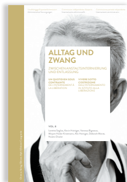
Volume 8 VIVERE SOTTO COSTRIZIONE. LA «RIEDUCAZIONE» TRA INTERNAMENTO IN ISTITUTO E LIBERAZIONE

Nel settimo volume si esaminano le procedure d'internamento seguite dalle autorità di quattro Cantoni in base ad alcuni casi di studio.