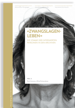
Volume 5 «ZWANGLAGENLEBEN» BIOGRAFIEN VON EHEMALS ADMINIST- RATIV VERSORGTEN PERSONEN

Nel quinto volume sono analizzate 58 interviste biografiche per determinare quali gruppi di persone erano oggetto di internamenti amministrativi, come hanno vissuto il periodo d'internamento in istituto e quali conseguenze tali provvedimenti hanno avuto sulla loro vita.