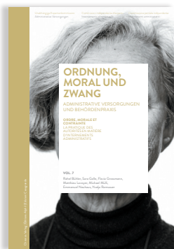
Volume 7 ORDRE, MORALE ET CONTRAINTE. INTERNEMENTS ADMINISTRATIFS ET PRATIQUE DES AUTORITÉS

Il sesto volume è dedicato alla dimensione quantitativa dell'internamento amministrativo. Esso fornisce stime differenziate del numero di persone coinvolte e illustra la rete e le collaborazioni tra gli istituti.