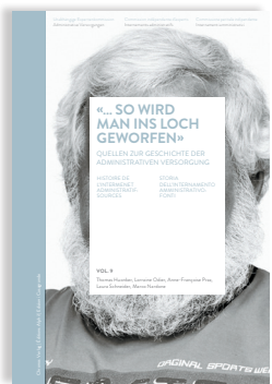
Volume 9 «... SO WIRD MAN INS LOCH GEWORFEN» STORIA DELL'INTER- NAMENTO AMMINISTRA- TIVO: FONTI

L'ottavo volume ripercorre la pratica e l'attuazione dell'internamento amministrativo negli istituti sulla base di diversi casi di studio.