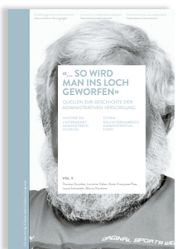
Volume 9 «... SO WIRD MAN INS LOCH GEWORFEN» HISTOIRE DE L'INTERNE- MENT ADMINISTRATIF: SOURCES

Le huitième tome retrace la pratique et la mise en œuvre de l'internement administratif dans les établissements à l'aide de plusieurs études de cas.