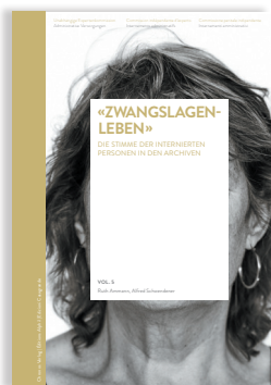
Volume 5 «ZWANGLAGENLEBEN» BIOGRAFIEN VON EHEMALS ADMINIST- RATIV VERSORGTEN PERSONEN

Sur la base de 58 entretiens biographiques, le cinquième tome décrit qui sont les personnes concernées par l'internement administratif, comment elles ont vécu leur internement et quelles ont été ses répercussions sur leur vie.