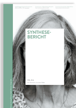
Volume 10 RAPPORT DE SYNTHÈSE

Le volume de sources de la CIE contient une sélection de textes rédigés par des personnes qui ont fait l'objet d'un internement administratif et par des personnes qui ont ordonné des internements administratifs.