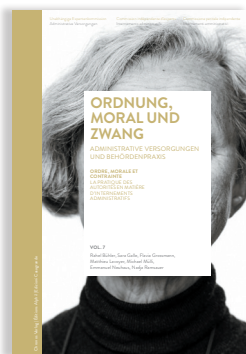
Volume 7 ORDRE, MORALE ET CONTRAİNTE. INTERNEMENTS ADMINISTRATIFS ET PRATIQUE DES AUTORITÉS

Le sixième volume est consacré à la dimension quantitative de l'internement administratif. Il livre une évaluation différenciée du nombre de personnes concernées et met en évidence les réseaux d'établissements.