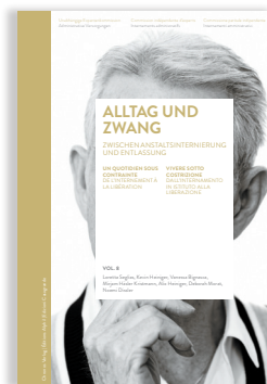
Volume 8 UN QUOTIDIEN SOUS CONTRAİNTE. DE L'INTERNEMENT À LA LIBÉRATION

Dans le septième ouvrage, la pratique des autorités est examinée au travers d'études de cas dans quatre cantons.